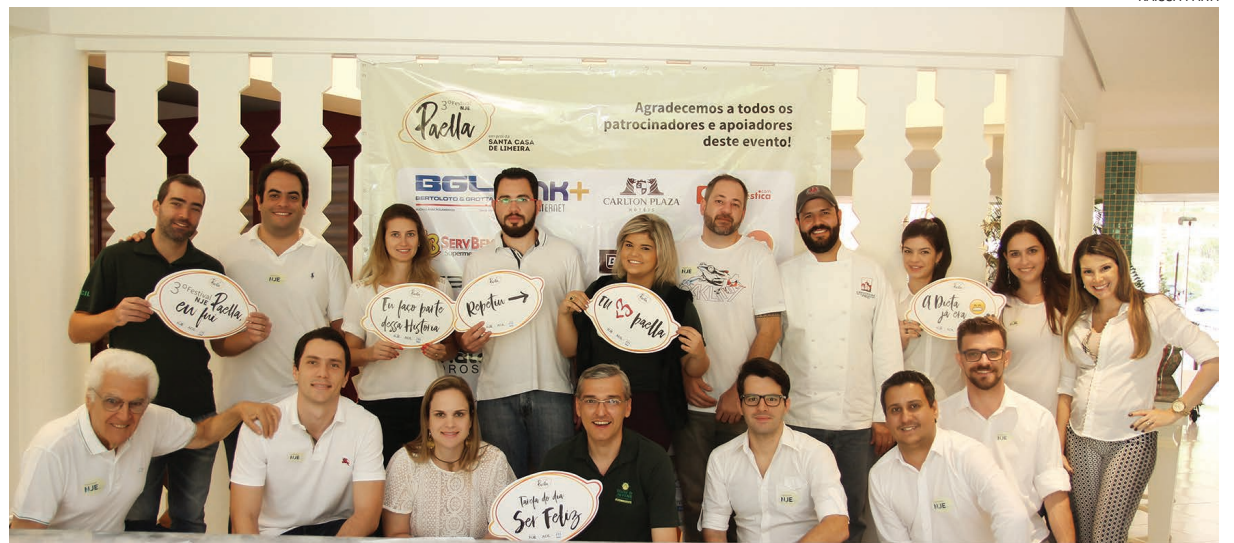
Integrantes do Núcleo de Jovens Empreendedores da ACIL