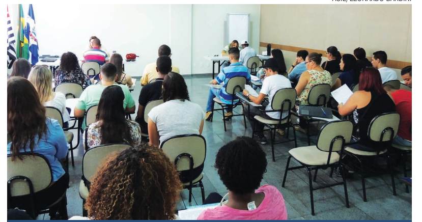
Com a ajuda do Banco de Currículos, as entrevistas foram feitas na ACIL com os candidatos selecionados

A Entidade oferece diversas ferramentas e estruturas com o intuito de auxiliar o dia a dia do associado, como o Banco de Currículos. Para aqueles que queiram utilizar o sistema, tanto candidatos quanto empregadores, basta acessar o site da ACIL ( www.acillimeira.com.br ) e clicar no link