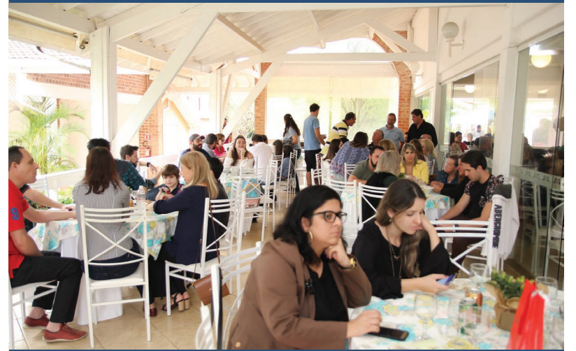
O 3º Festival NJE – Paella contou com a presença de 150 pessoas