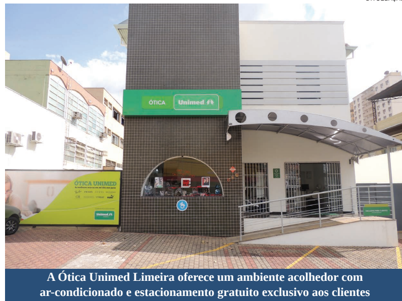
A Ótica Unimed Limeira oferece um ambiente acolhedor com ar-condicionado e estacionamento gratuito exclusivo aos clientes

Criada há mais de 10 anos para oferecer qualidade e sofisticação para todos os públicos, a Ótica Unimed Limeira é a única do segmento no município especialista nas Lentes Varilux, com exclusividade ‘Visiooffice’ – aparelho que tira medidas precisas do multifocal, altura e distância – específicas de cada pessoa.