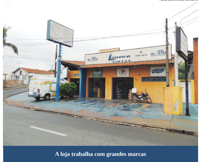
A loja trabalha com grandes marcas

A Limeira Tintas convida todo o público para conhecer os produtos e a qualidade dos serviços oferecidos. As lojas encontram-se na Av. Campinas, 1520, na Vila Conceição e na Av. José Alberto Campanini, 134, no Jardim Roseira. O horário de atendimento é de segunda a sexta-feira, das 8h às 18h, e aos sábados, das 8h às 12h. Os telefones para contato são (19) 3441-6614 e 3443-2600.